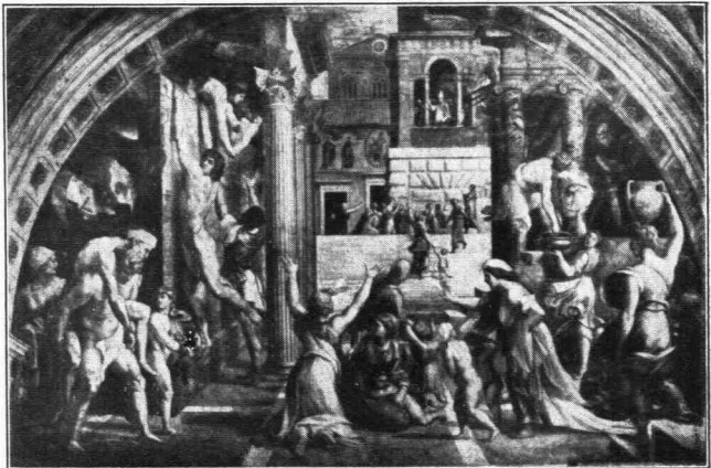
Ἡ πυρκαϊὰ τοῦ Βορῆο. Ἔργον τοῦ Ραφαήλ

Ἡ «Σχολή τῶν Ἀθηναίων» εἶναι μία φανταστική συγκέντρωσις ὄλων τῶν φιλοσόφων τῆς Ἑλλάδος πάσης ἐποχῆς. Εἰς τὴν σύνθεσιν ταύτην ὄλα εἶναι ὑπεράνθρωπα, ἀθάνατα. Οὐδέποτε τὸ πνεῦμα καλλιτέχνη συνέλαβε δυνατωτέραν σύνθεσιν, μορφὰς ἀγερωχοτέρας, τολμηροτέρας, διάκοσμον πρωτοτυπώτερον καὶ ποικιλώτερον. Ἡ εἰκὼν αὕτη ἀποτελεῖ τὴν ἀποθέωσιν τῆς ἀνθρωπίνης ἐπιστήμης. Παριστᾷ μίαν στοὰν μὲ θόλους ἀποτελοῦσαν τὸ ὠραιότερον Ἱερὸν τῆς Σοφίας, τὸ ὁποῖον χεῖρ ζωγράφου ἀπεικόνισε ποτέ. Τὸ διακοσμῶν τὰ ἀγάλματα τῆς Ἀθηνᾶς καὶ τοῦ Ἀπόλλωνος. Οἱ σοφοί