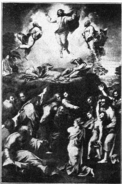
Ἡ «Μεταμόρφωσις τοῦ Σωτῆρος» τοῦ Ραφαήλ

Καὶ ἐρχόμεθα εἰς τὸ ἄλλο κολοσσιαῖον ἔργον τοῦ — τὸν «Παρνασσόν», τὴν ἀποθέωσιν ταύτην τῆς Ποιήσεως. Εἶναι μία εἰκὼν